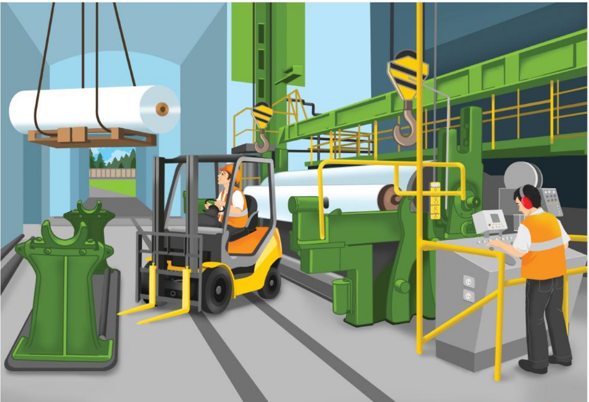
Pomoc dydaktyczna stanowi integralną część scenariusza zajęć z numeru 2.161 luty 2015 miesięcznika BLUŻEJ PRZEDSZKOLA. Rysunki i zdjęcia chronione są prawami autorskimi – kopiowanie, odsprzedaż, dystrybucja w internecie lub wykorzystywanie w innych celach niż przeznaczono jest niedozwolone.