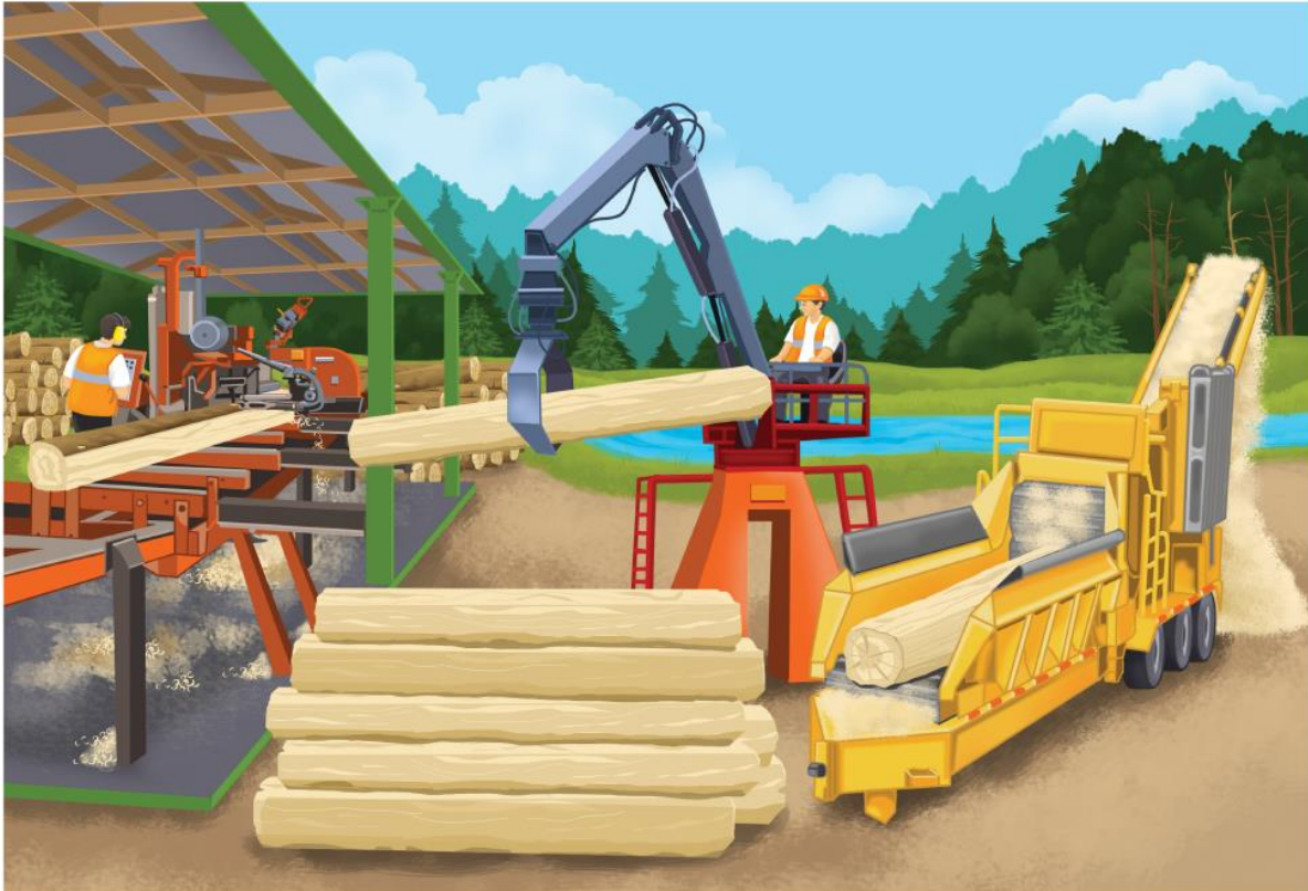
Pomoc dydaktyczna stanowi integralną część scenariusza zajęć z numeru 2.161 luty 2015 miesięcznika BLUŻEJ PRZEDSZKOLA . Rysunki i zdjęcia chronione są prawami autorskimi – kopiowanie, odsprzedaż, dystrybucja w internecie lub wykorzystywanie w innych celach niż przewidziano jest niedozwolone.