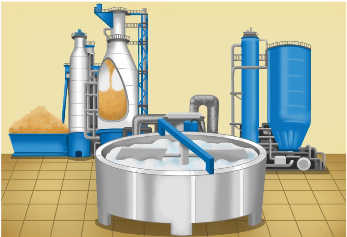
Pomoc dydaktyczna stanowi integralną część scenariusza zajęć z numeru 2.161 luty 2015 miesięcznika BLUŻEJ PRZEDSZKOLA . Rysunki i zdjęcia chronione są prawami autorskimi – kopiowanie, odsprzedaż, dystrybucja w internecie lub wykorzystywanie w innych celach niż przewidziano jest niedozwolone.